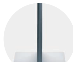
PROFILÉ. Epaisseur 2 cm