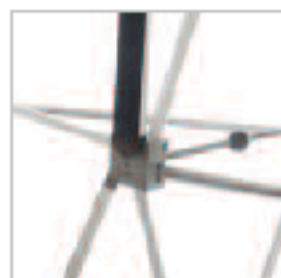
BARRE MAGNETIQUE. Aimantation