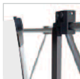
SUSPENTE HAUTE. Aimantation