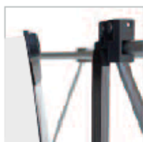
SUSPENTE HAUTE. Aimantation