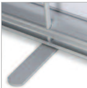
CARTER ET MAT. Aluminium